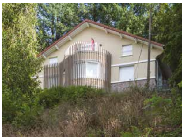
Le CNAM au Clos du Château