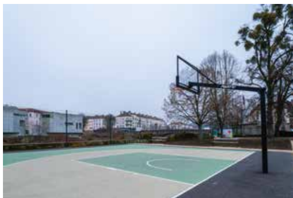
Aire de basket 3x3 au Parc du Cours