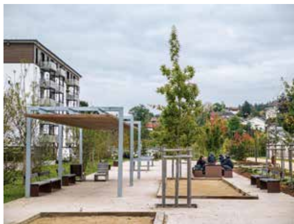
Mail David-et-Maigret - Quartier Bitola