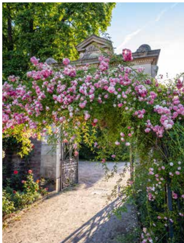
Parc de la Roseraie