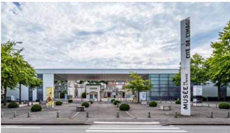
La Cité de l'Image