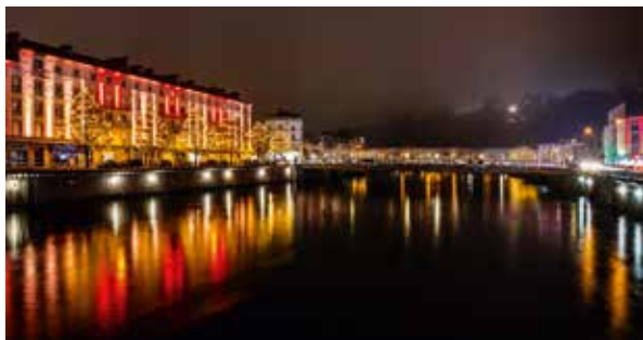
Façades illuminées quai Lopicque en décembre