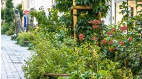
Végétalisation rue des Minimes