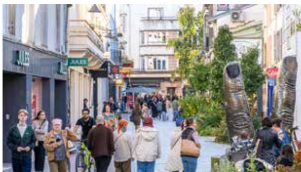
Rue des Minimes