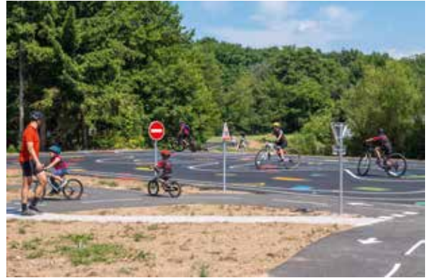
Plateforme pédagogique Site Durupt à Saint-Laurent