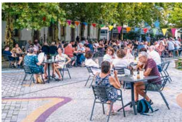
Guinguette du marché

Le magasin Monoprix a souhaité déployer l'espace alimentaire de son magasin dans une partie de la galerie Saint-Nicolas.