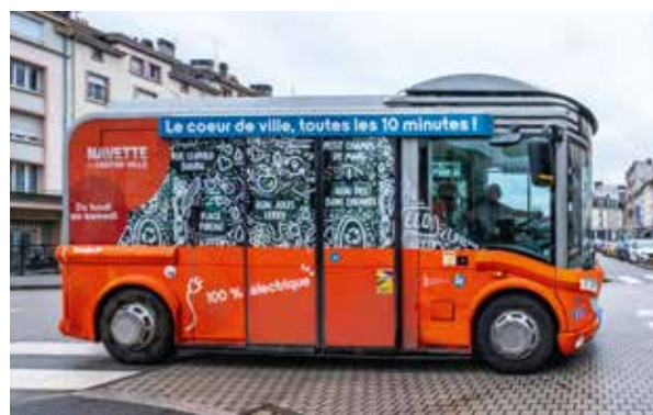
La navette du centre-ville