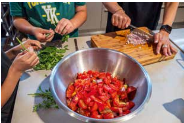
Activité dans le cadre de l'Aménagement du Temps de l'Enfant (ATE)

élèves grâce à la pratique instrumentale collective sur temps scolaire avec des professeurs du Conservatoire Gautier-d'Épinal.