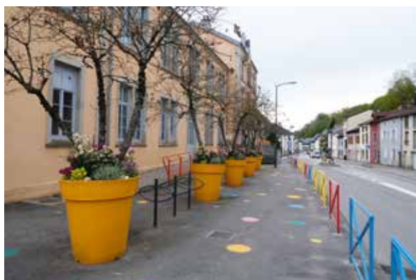
Aménagement aux abords de l'école d'Ambrail