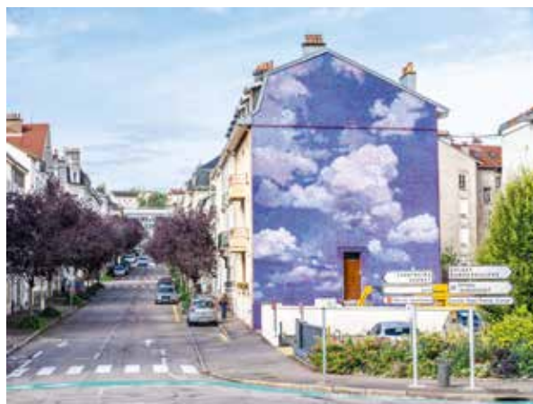
« Ceci n'est pas un ciel » Nadège Dauvergne