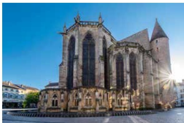
La basilique Saint-Maurice

Continuer à entretenir, restaurer et valoriser le patrimoine vaste et diversifié de la Ville pour le transmettre aux générations futures et contribuer à la mémoire collective.