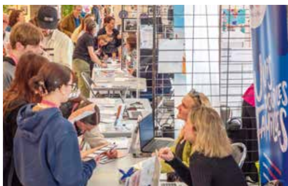
Le forum des aidants