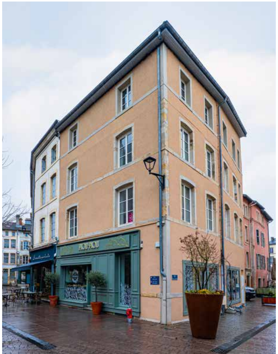
Opération de Restauration Immobilière (ORI) Immeuble situé 10, rue du Palais de Justice.