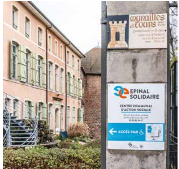
CCAS - « Epinal solidaire »

Être acteur des solidarités et soutenir les associations sociales et solidaires afin de lutter contre la pauvreté et la précarité.