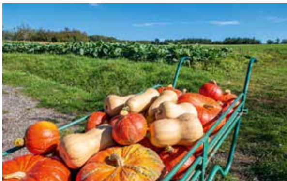
Régie maraîchère -Laufromont