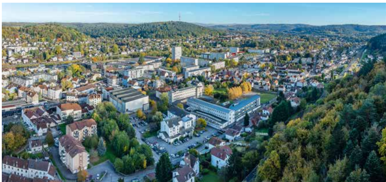
Quartier du Champ-du-Pin