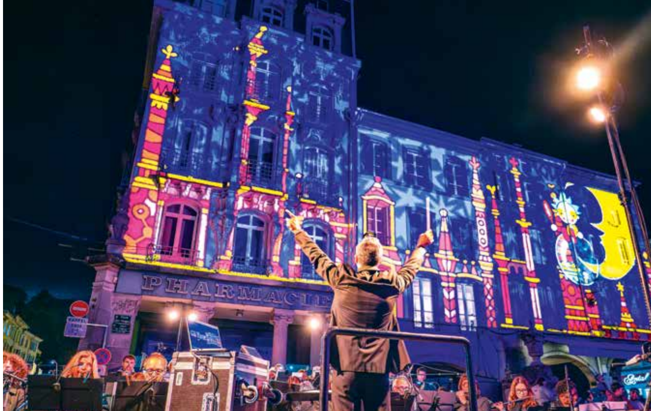
Les Nocturnes des Imaginales