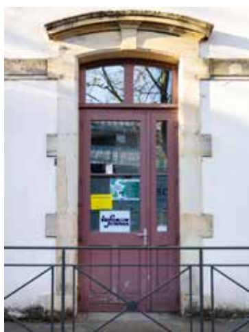
l'E/space & labo