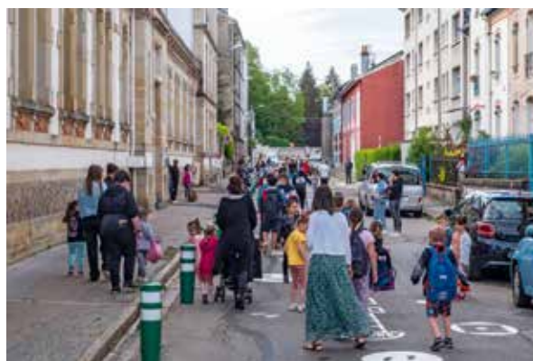
La rue aux écoles