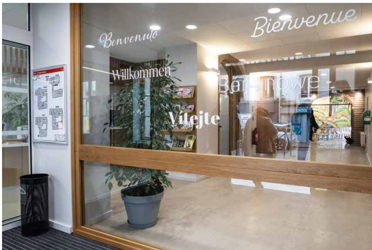
Hôtel de ville - Guichet unique