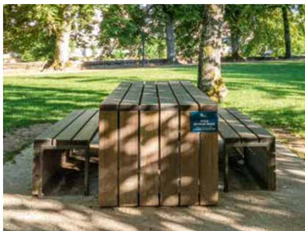
Table de pique-nique réalisée dans le cadre du budget participatif