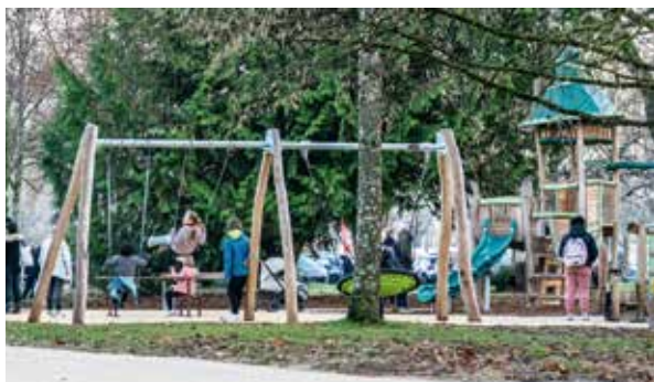
Aire de jeux inclusifs Parc du Cours