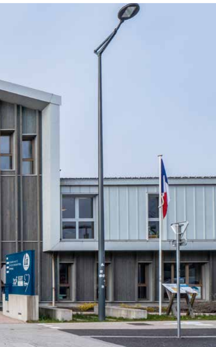
Maison de l'Habitat et du Territoire