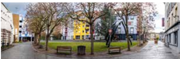
Place de la Chipotte