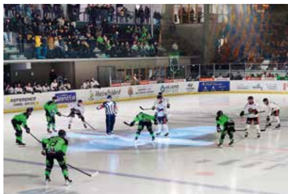
Patinoire de Poissompré