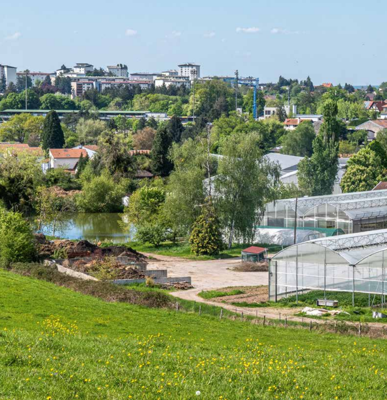
Projet alimentaire de territoire - Régie maraîchère