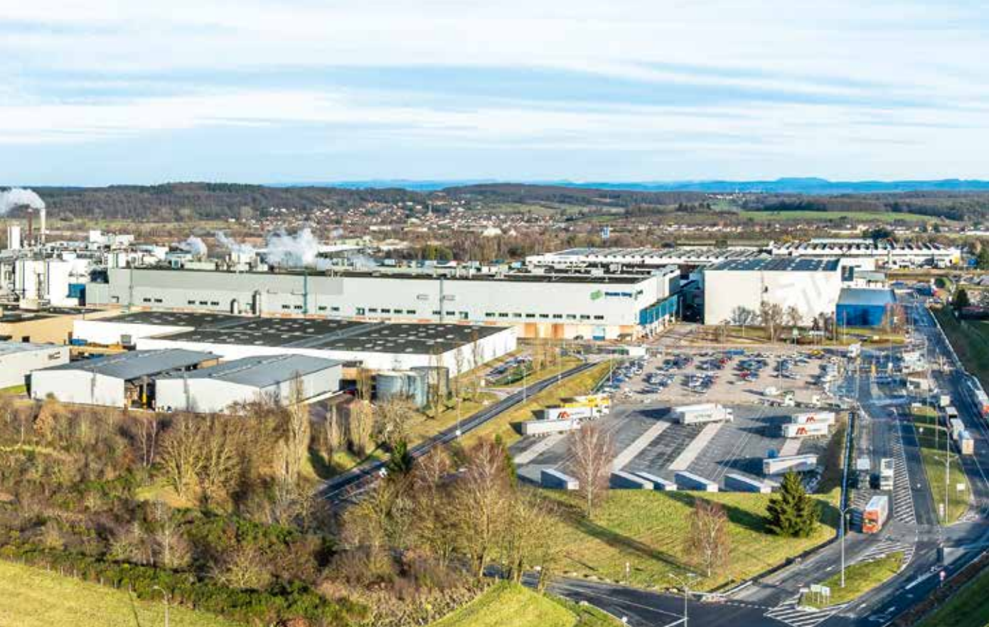
Green Valley - Ecoparc