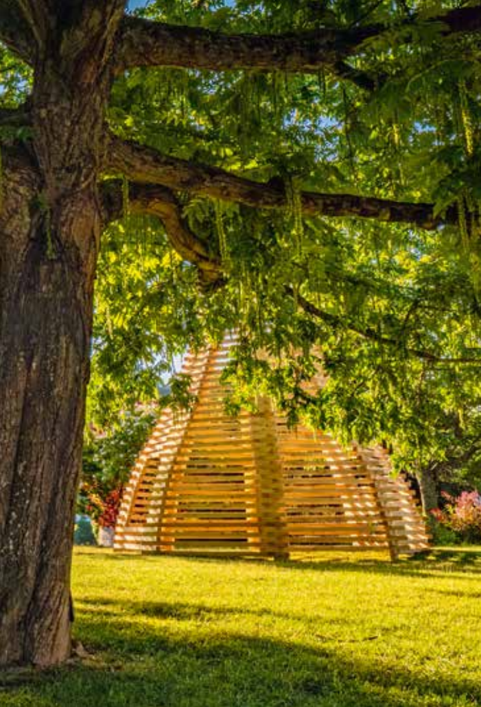
Parc de la Maison romaine