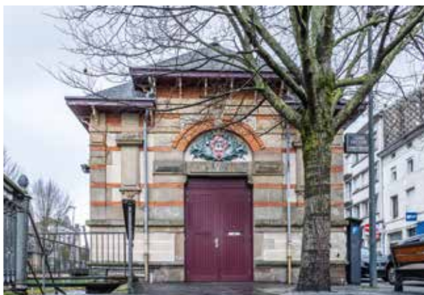
Le lavoir théâtre Georges Brassens