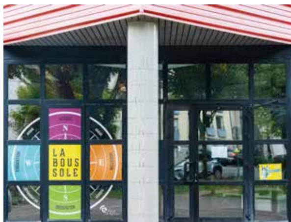
Le service d'insertion « La Boussole ».

Nous développerons de nouveaux partenariats dans le cadre de France Travail et de l'accompagnement des bénéficiaires du RSA, notamment avec le CCAS de la Ville, la Mission locale d'Epinal et les services du Département des Vosges en charge de l'insertion.