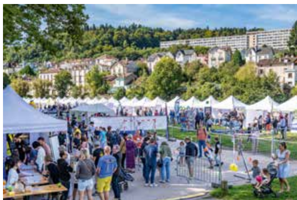
Associations en fête