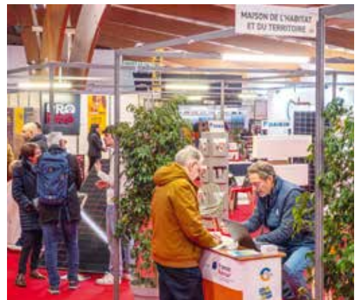
Salon Planète Energie