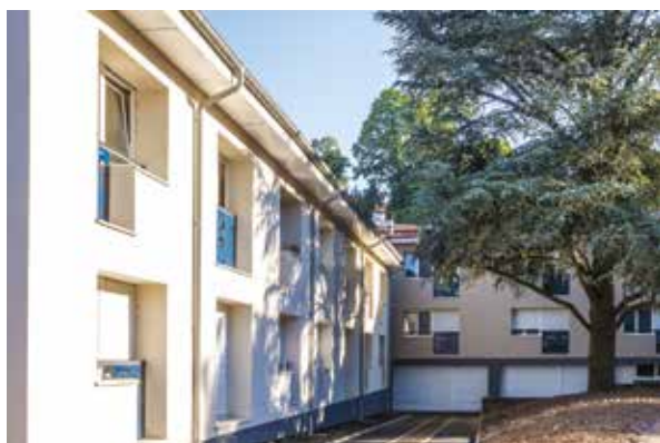
La résidence autonomie « Sans Souci »