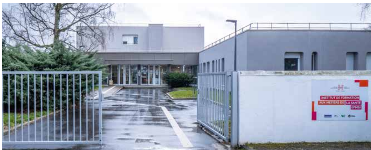
Nouvel Institut de Formation aux Métiers de la Santé (IFMS)