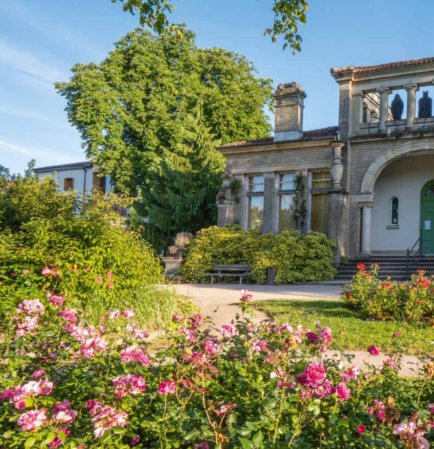
La Maison romaine