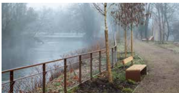
Nouvelle passerelle sud de l'île du Champ-du-Pin

Ce projet de renouvellement urbain est en cours de labellisation Ecoquartier et il a été récompensé par le Grand Prix du jury de l'Agence de l'Eau Rhin-Meuse , confirmant la pertinence des orientations qu'il suit.